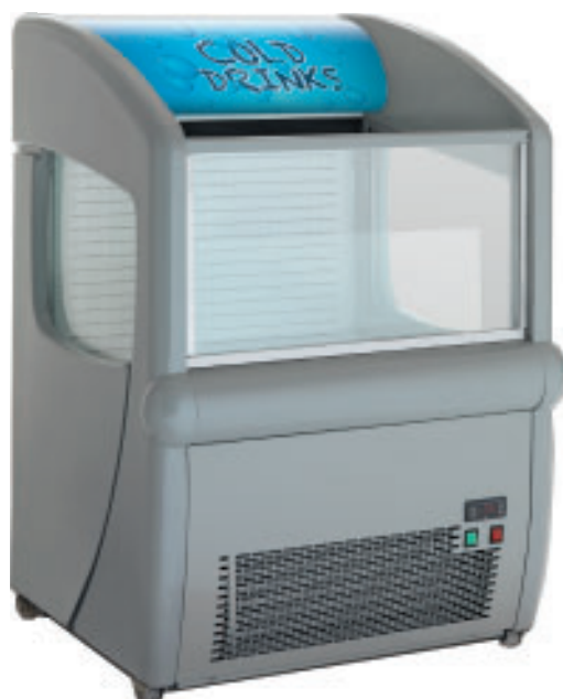
OTF 90 / OTC100