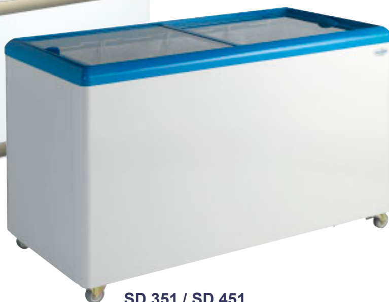
SD 351 / SD 451