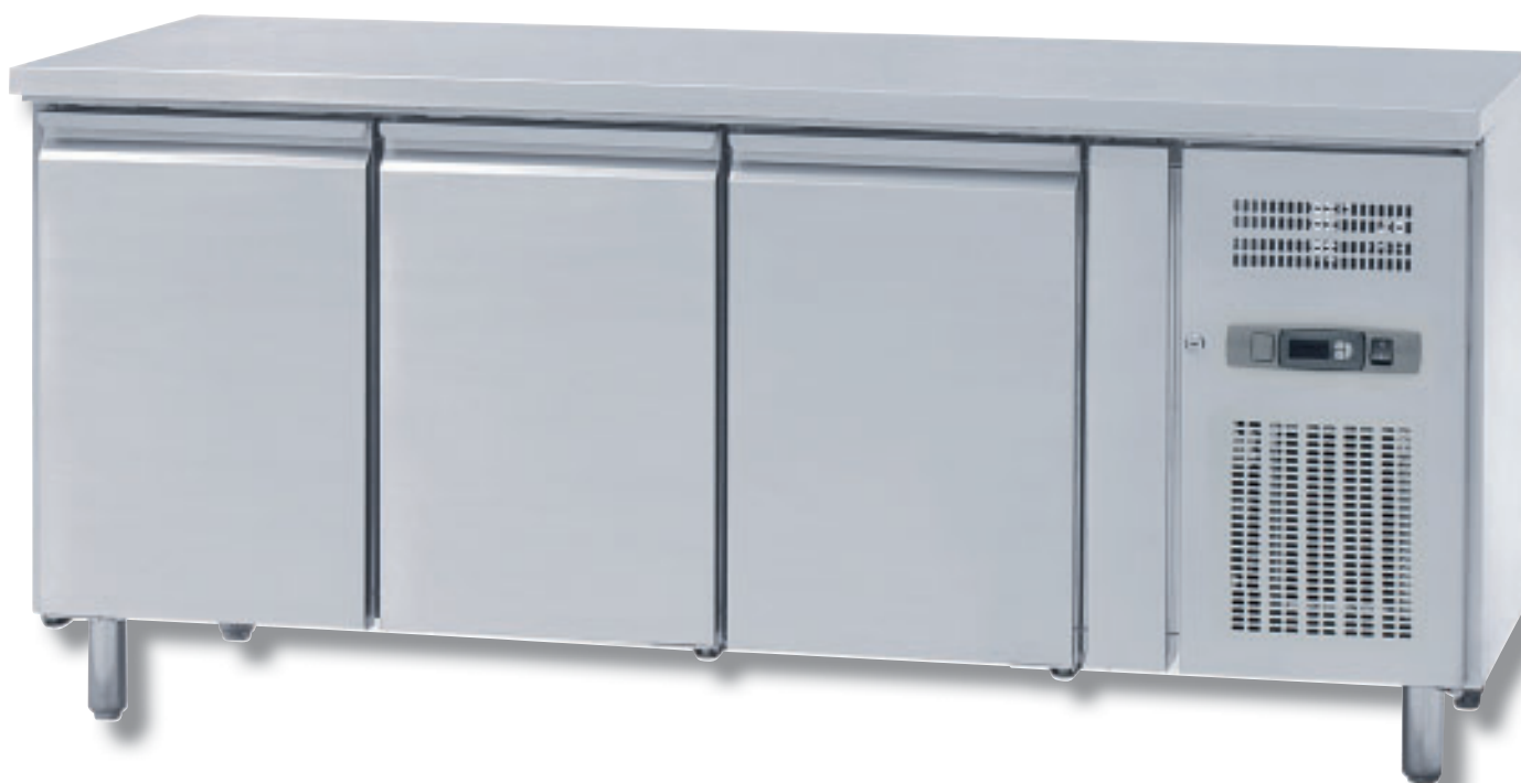
BK 123/BF 133