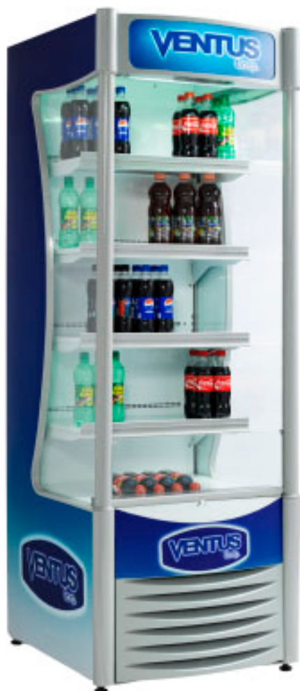
OFC 70 / OFC 90