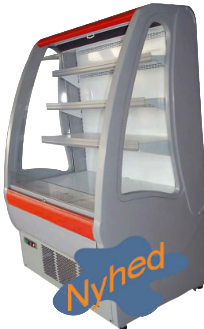
OFC 105 / OFC 125