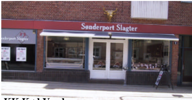
KK Kød Varde