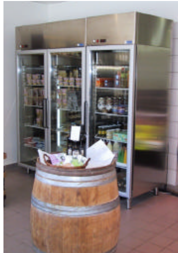
Højskabe med hhv. køl og frys. Rustfrit stål ind- og udvendig.