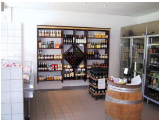
Smuk og stilren indretning