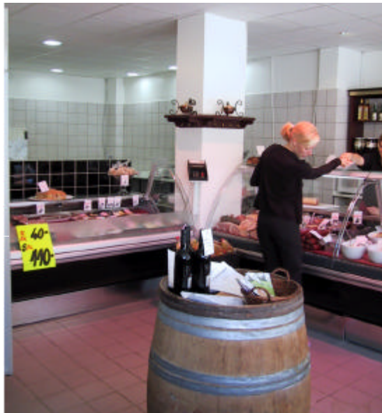
Prestige Selvbetjeningsdisk til venstre og Prestige ekspeditionsdisk til højre