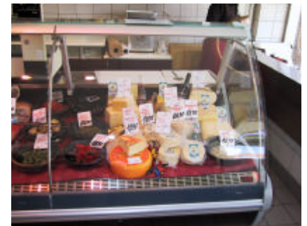
Prestige ekspeditionsdisk - Let at overskue det store udvalg

← Selvbetjeningsdisk - set bagfra, med kølede magasiner