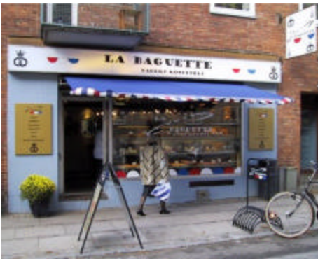
Indgangen til den flotte bagerbutik: La Baguette, Charlottenlund.