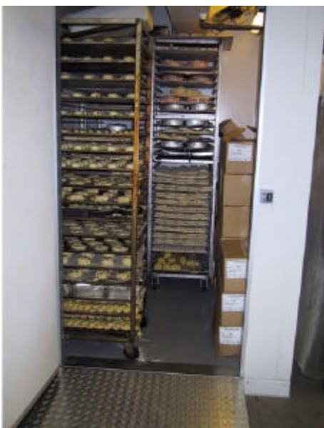
Her ses fryserummet forfra, hvor stikvogn- ene med bagerbrød køres direkte ind i fryserummet.

At der er trængsel i bagerbutikken er ikke noget særsyn hos "La Baguette". Kunderne står gerne i kø for at få brød af højeste kvalitet. Det kan ligefrem være en fordel at få lidt betænkningstid inden man når kassen, for der er mange spændende brødvarianter at vælge imellem.