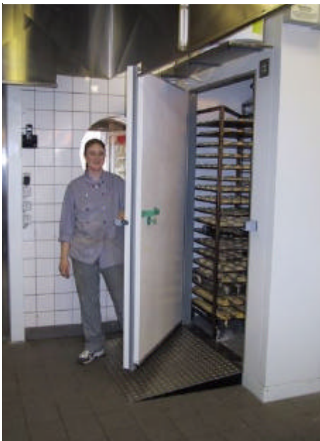
Bagerbutikken har investeret i et modul- fryserum fra den tyske producent CELLTHERM.